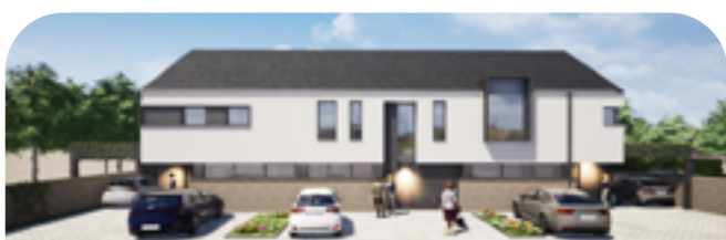
Hondelange 4 maisons et 3 appartements de standing