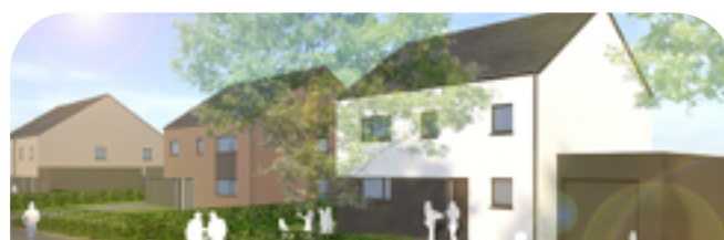
Arlon - Frassem - 22 maisons 3 ou 4 facades de haute qualité (50% vendus) - Situées dans un écrin de verdure à deux pas du centre ville